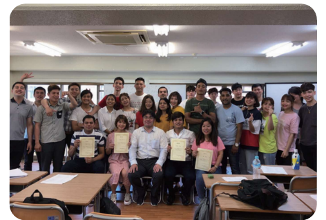
Buổi hưng biện tiếng Nhật