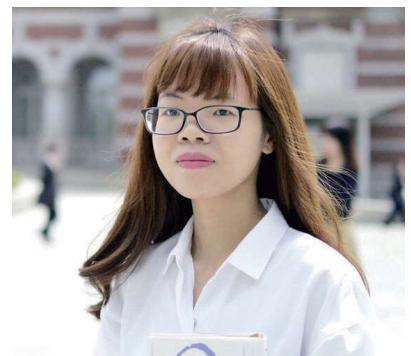
Đi làm tại công ty lớn của Nhật Nơi sinh: Việt Nam

Học viện ngôn ngữ Tokyo, là nơi có thiết bị rất tốt và sạch sẽ. Có rất nhiều du học sinh từ các nước khác nhau đến du học. Chính nơi đây đã tạo điều kiện cho tôi có thể kết bạn với các nước khác nhau. Ngoài ra chúng tôi còn có thể học thêm được văn hóa Nhật như kinh nghiệm mặc kimono, trà đạo, v.v... Những ngày nghỉ thì chúng tôi thường tham gia những sự kiện, những chuyến dã ngoại xa rất thú vị. Tôi khuyên các bạn hãy đến học tại học viện ngôn ngữ Tokyo, các bạn sẽ gặp được những giáo viên rất nhiệt tình và những người bạn rất tốt.