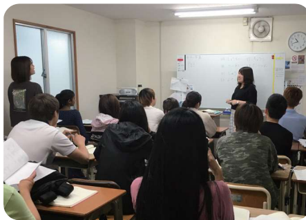
Khung cảnh giờ học