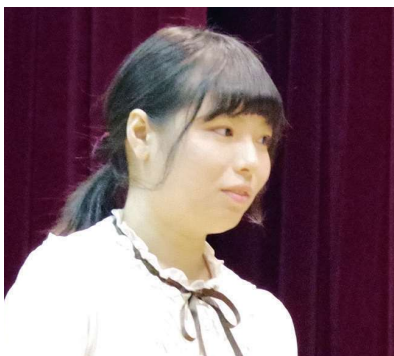
Đại học Oberlin bậc cao học Nơi sinh: Trung Quốc