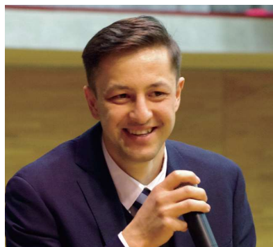
Đại học Chiba Nơi sinh: Uzbekistan

Trước khi đến Nhật Bản, tôi không có nhiều cơ hội để nói tiếng Nhật và tôi không tự tin vào cách phát âm của mình. Tuy nhiên, khi tôi học lớp tiếng Nhật mỗi ngày, tôi đã có thể nói tiếng Nhật từng chút một, và bây giờ tôi có thể làm việc bán thời gian trong kỳ nghỉ hè, tôi đã có thể làm quen với cuộc sống ở Nhật một cách nhanh chóng. Tôi có thể vào Đại học vì được các giáo viên đã hướng dẫn cho tôi các bước nhập học rất nhiệt tình, tỉ mỉ. Ngoài ra tôi còn có thể tham khảo thêm ý kiến các nhân viên văn phòng. Khi tôi gặp khó khăn trong sinh hoạt hàng ngày thì nhân viên văn phòng đã hỗ trợ tôi giải quyết những khó khăn, nên tôi rất an tâm khi học tại trường