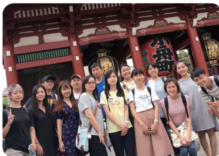
Lớp học ngoại khóa