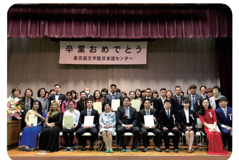
Lễ Tốt nghiệp