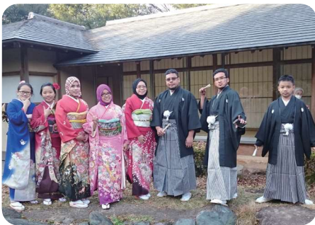
Trải nghiệm văn hóa Nhật Bản