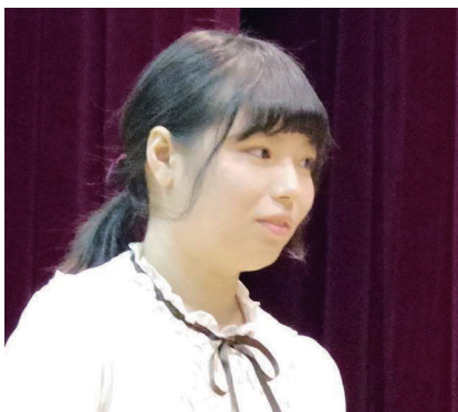
櫻美林大學 大學院 出身地 中國